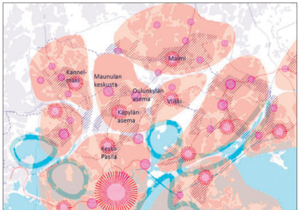
Asumisen Helsingin visiokuva, johon on merkitty rasterilla asumisen kehityksen painopistealueet. Kuvassa on ympyrällä merkitty toiminnalliset kaupunginosakeskukset ja tähdillä suuremmat kaupunginosakokonaisuuksien keskukset.